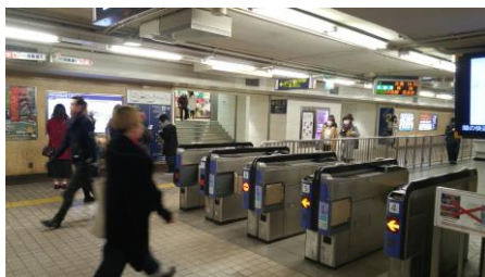
①東改札口（電車発進方向とは逆の突き当りの改札）を出て、右の階段側（旧マルイ）側へ行きます

【阪急電車でお越しの方】「京都河原町」駅・出口2～西木屋町店 ※注意※ 2020年11月7日(土)～2021年1月15日(金)まで、 この出口は工事のため封鎖されています。