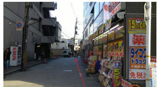
⑥ドラッグストア（ダイコクドラッグさん）の前で左に曲がり、マルイとドラッグストアの間の道を奥まで進みます