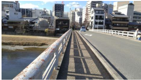
⑤鴨川に架かる橋（団栗橋）を渡ります