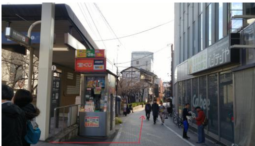
④出口を出て左にある宝くじ売場の横の通りを突き当りまで進みます