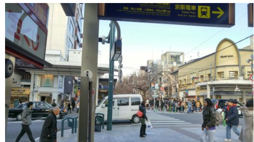
③階段を上がって出口を出たところ。四条木屋町の交差点です