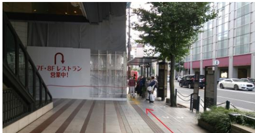
⑤阪急出口から左に体を向けると、バス停が見えます。バス停方向へ曲がり角まで進みます