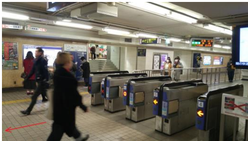
①東改札口（電車発進方向とは逆の突き当りの改札）を出て、そのまま直進します