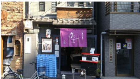
⑧木屋町店前に到着です