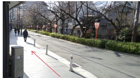
⑥橋を渡りきったところで左折し、木屋町通を進みます