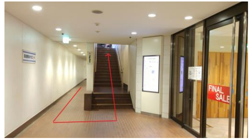
③突き当たりの階段を上がり、地上に出ます