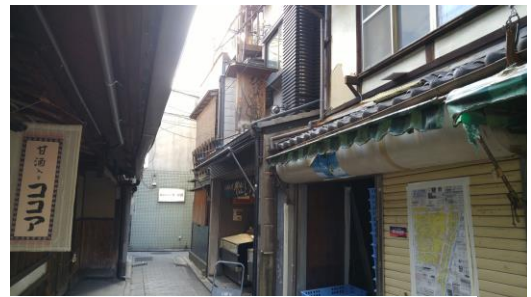
⑦西木屋町店前に到着です