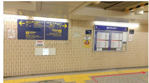
②突き当りを右折。B 出口の方向（時刻表がある方）へ進みます