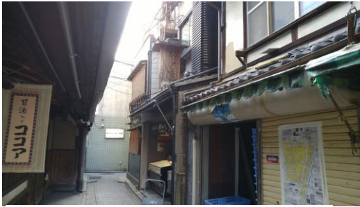
⑨西木屋町店前に到着です