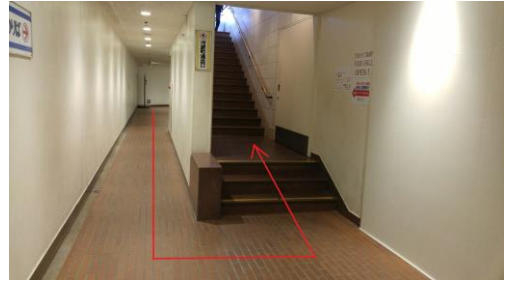
③突き当たりの階段を上がり、地上に出ます