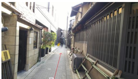
⑧細い道を進みます