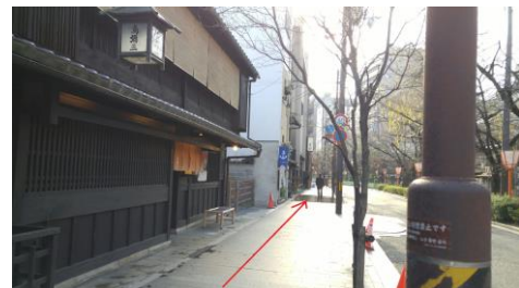
⑦木屋町通を進みます (写真は鳥彌三さん前)

【阪急電車でお越しの方】「京都河原町」駅・出口2～西木屋町店 ※注意※ 2020年11月7日(土)～2021年1月15日(金)まで、 この出口は工事のため封鎖されています。