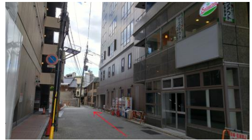
⑥曲がり角で左に曲がります（右手側のビルの2階に Saizeriya さんがあるのを目印にしてください）。奥まで進みます