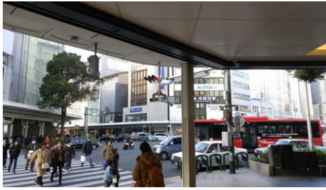
④地上に出ると四条河原町の交差点です（すぐ前の横断歩道の先には高島屋が見えます）