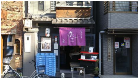
⑧木屋町店前に到着です