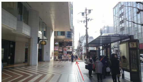
⑤阪急出口から左に体を向けると、バス停・ドラッグストアが見えます。ドラッグストア前まで進みます