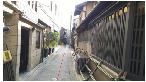
⑥細い道を進みます