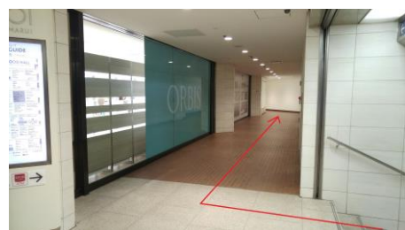
②マルイ入口前の階段を上がり、右折します