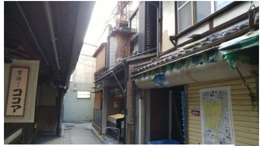
⑦西木屋町店前に到着です